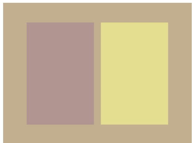
Fig.4 Lo sfondo è più vicino al rosso cupo