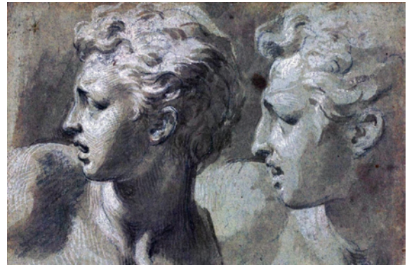
Bozzetto di studio del Parmigianino

In questi disegni vi è la sola variazione di tonalità. Spesso il pittore utilizza anche le variazioni di tinta e saturazione e lo fa consapevolmente al fine di ottenere un insieme cromatico coerente.