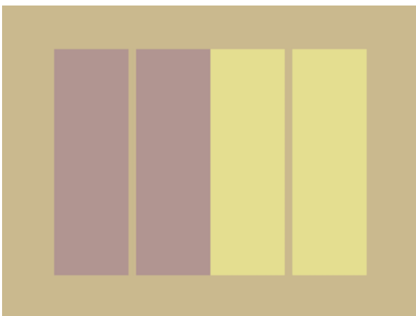
Fig.2 Lo sfondo è il colore medio

Modificando il colore dello sfondo si capovolge di nuovo l'ordine percettivo (fig.4). Ora è il colore più chiaro e saturo ad occupare il primo piano e quello più scuro e spento passa in secondo piano.