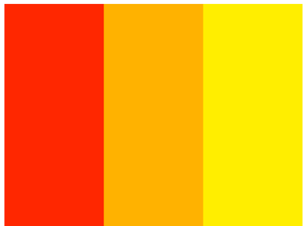
Fig.6 Le tinte dei colori (fig.3) nel rispettivo ordine

È con l’aggiunta di grigio che un rosso diventa spento e cupo a tal punto da sembrare un viola.