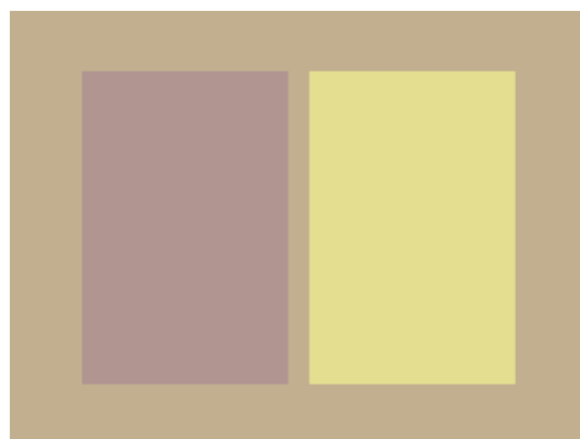
Fig.4 Il colore intermedio è più vicino al “viola” e più lontano dal “giallo”

Una chiave sta nell’osservare i CONFINI tra le superfici di colore (fig.3).