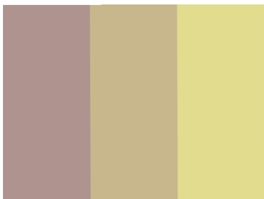
Fig.3 Il colore intermedio è equidistante dagli altri due

“Ad occhio” si può infatti misurare la distanza visiva tra i colori.