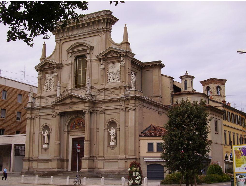
Chiesa di San Bartolomeo, Bergamo