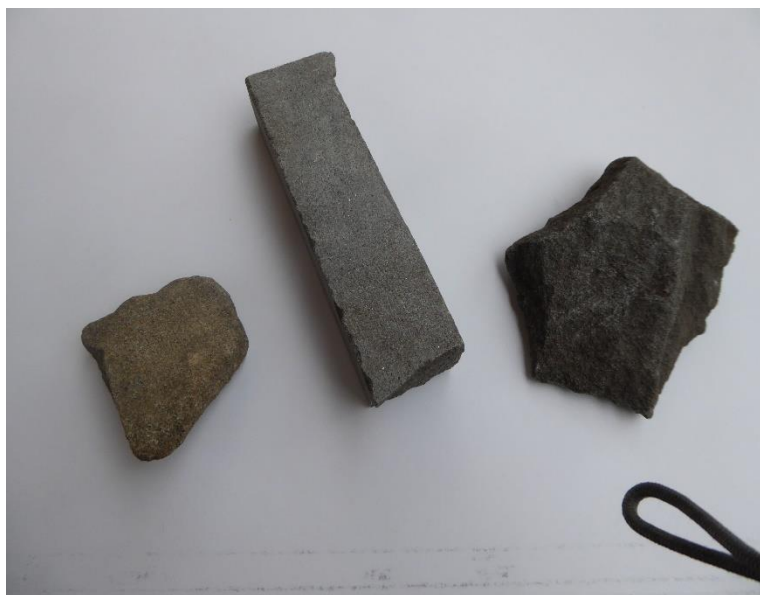
Tre campioni di Arenaria, da me raccolti a Sarnico.

Com'è fatta? Come tutte le arenarie, è una antica sabbia che è diventata roccia. Il colore è grigio uniforme, con sfumature verso il bruno e verso l'azzurro. Niente a che vedere con l'Arabescato Orobico! La grana, mediamente dell'ordine del millimetro, è variabile da zona a zona. Una grana fine, ma soprattutto uniforme, fornisce una pietra ornamentale più pregiata. Contiene quarzo, granellini di rocce varie, argilla ed è cementata da calcite.