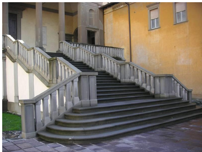
Due impieghi fuori Bergamo. A sinistra, la Chiesa di Bienno, con il portale scolpito in Arenaria di Sarnico. A destra la scalinata che accede alla Chiesa di Pontida.